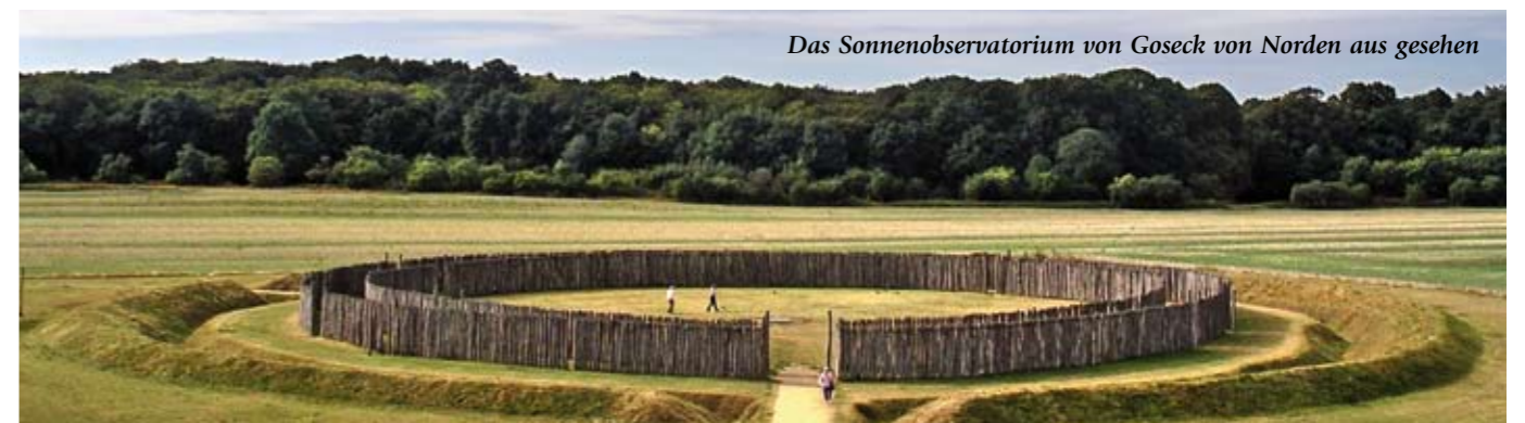
Das Sonnenobservatorium von Goseck von Norden aus gesehen

wie neuere Untersuchungen zeigen, auch den Termin des so genannten Frühlingssolstizes. Der 01. Mai wird noch heute, zirka 7.000 Jahre später, gefeiert. Über den äquinoktialen Herbstpunkt liegen offenbar noch keine Erkenntnisse vor. Archäologische Befunde von Ausparungen in den Holzpalisaden lassen diese als so genannte Zeitmarken erscheinen, um neben dem 01. Mai auch den 09. April, den 01. August und den 04. September zu markieren. Damit wäre es möglich, dass auch die Walpurgisnacht gut 7.000 Jahre alt ist.