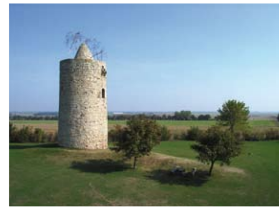
Pole-Aerial Photography an der Eichstädter Warte bei Langeneichstädt in 8 Meter Höhe